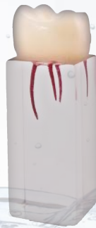
Molar para endodencia. Ref. 0905105