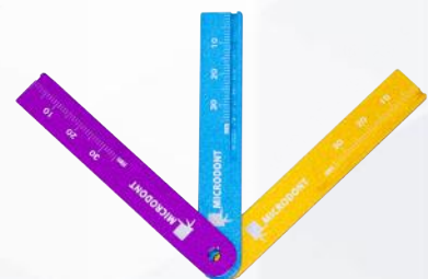
Micro regla endodencia. Ref. 11/015