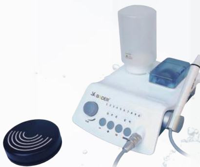
Scaler de ultrasonidos. Ref. 09070007