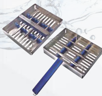
Casete porta instrumentos 10 instrumentos. Ref. 11/002