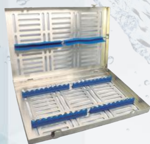
Casete doble 20 instrumentos. Ref. 11/000