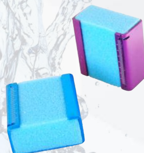
Esponjero con regla. Ref. 11/013