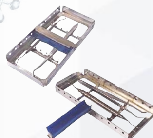
Casete porta instrumentos 5 instrumentos. Ref. 11/001