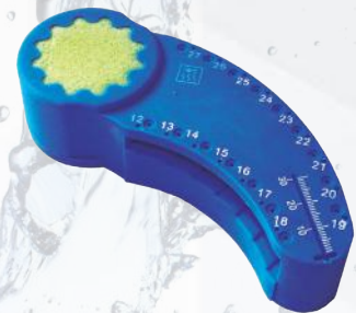
Placa/Bloque de prueba de endodencia. Ref. 11/008