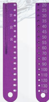
Calibrador de gutapercha 20-140. Ref. 11/019