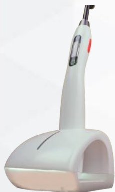
Fotodinamic Led Light. Ref. 09070051