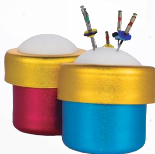
Mini esponjero redondo. Ref. 11/017