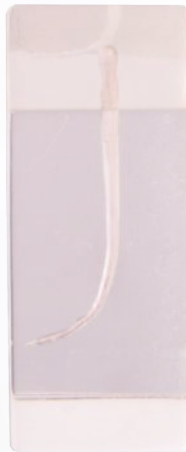
Modelo para prácticas de en endodencia. Ref. 0905103