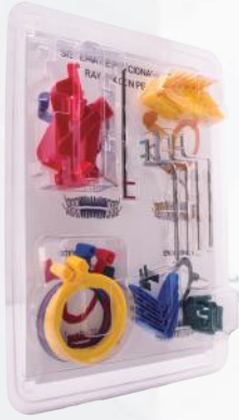
Posicionador radiográfico. Ref. 11/018