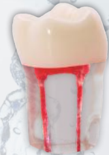
Molar con conductos radiculares. Ref. 0905104