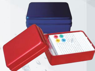
Caja de desinfección de fresas de 180 hoyos. Ref. 11/009