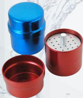
Mini fresero redondo. Ref. 11/014