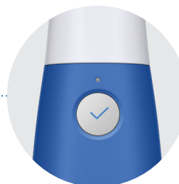
Botón de Inicio de Escaneo