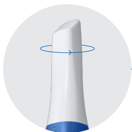
Punta reversible de 180°