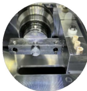
Titular especial Con dispositivo de sujeción especial